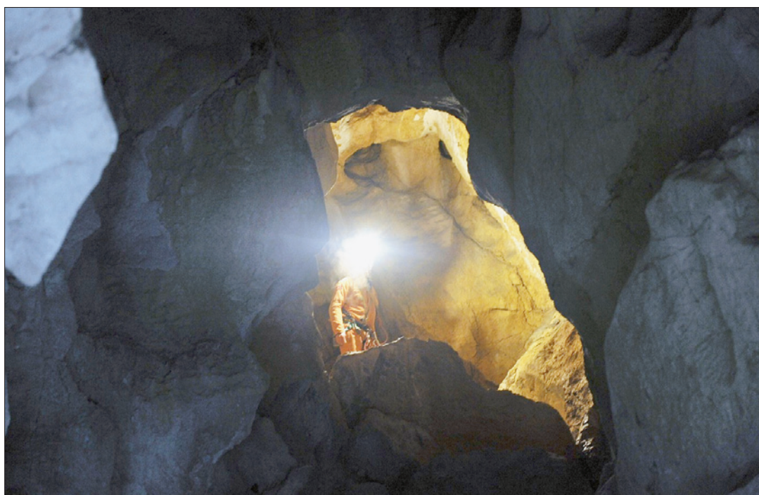
PATIENCE Un sauveteur attend en haut du premier puits du gouffre de Pertuis.

«Lors d'un accident en extérieur, il n'y a généralement qu'une seule phase dans le sau-