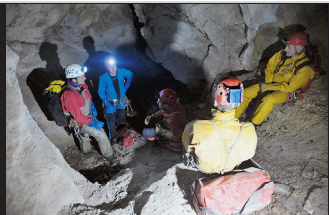
PÉRILLEUX Avant de descendre dans le gouffre de Pertuis, il faut d'abord y grimper... Une fois à l'intérieur, les sauveteurs devront se concerter et surtout s'armer de patience.